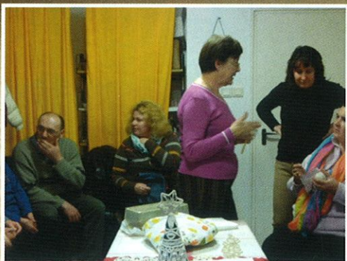
NYÍLT NAP A KÉZMŰVES KLUBBAN