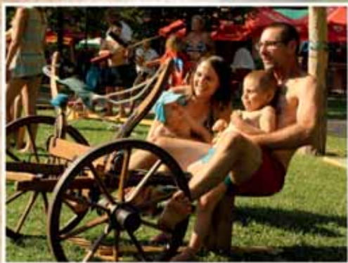
CSALÁDI NAP TOBRUKBAN

2018. augusztus | 28. évfolyam | 8. szám