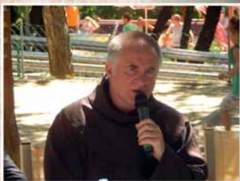
BÖJTE CSABA BALATONFÜZFŐN