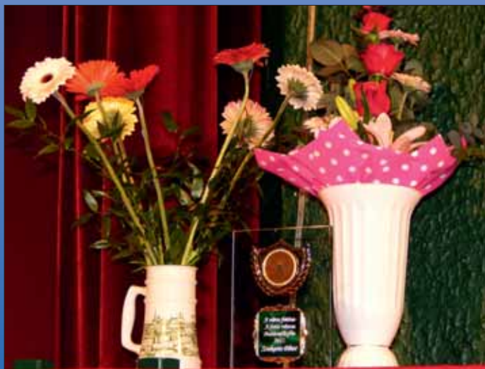
Város fotósa – a fotós városa®