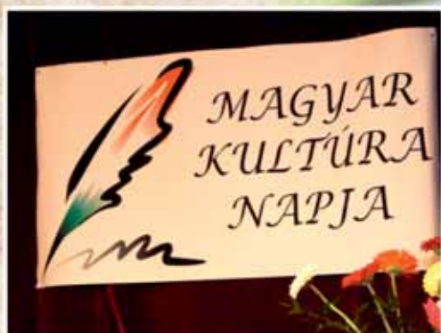
A MAGYAR KULTÚRA NAPJA