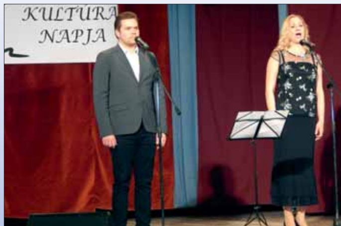
Fotók: Fruzszné Kőmög Zsuzsa