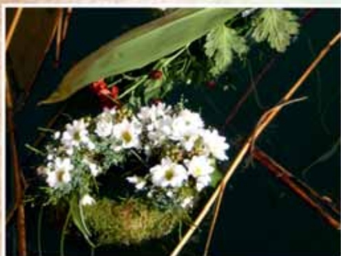
A BALATON MEGÁLDÁSA