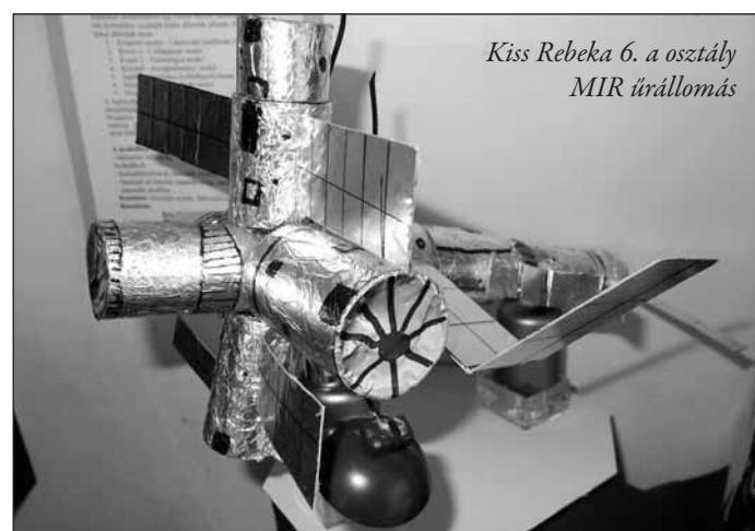
Kiss Rebeka 6. a osztály MIR űrállomás