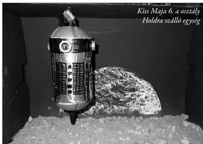
Kiss Maja 6. a osztály Holdra szálló egység