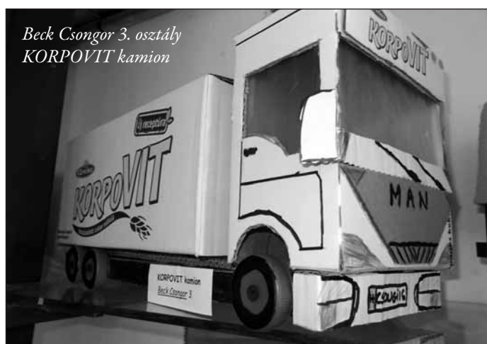
Beck Csongor 3. osztály KORPOVIT kamion