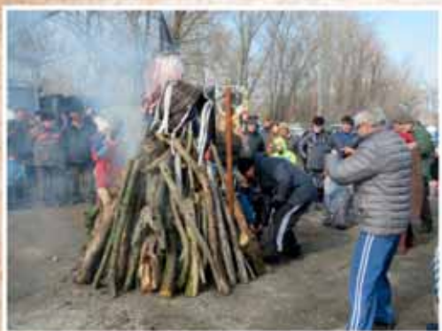
TÉLBÜCSÚZTATÓ A HORGÁSZTANYÁN