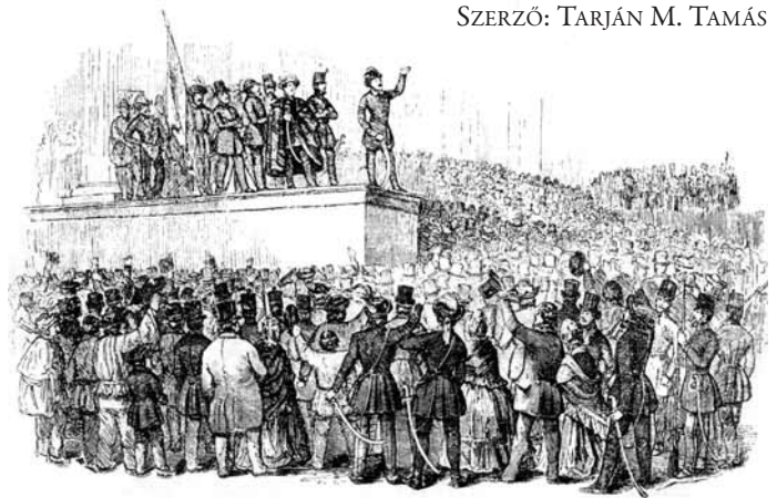
Petőfi a Múzeum lépcsőjén a „Nemzeti dal” szavaja