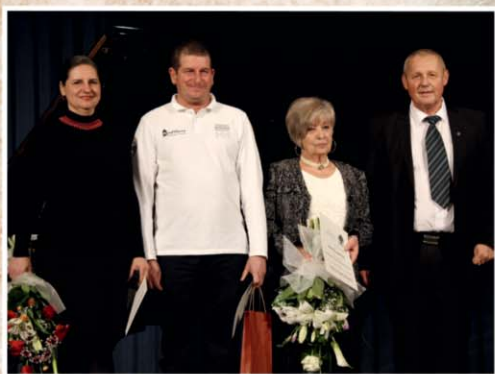
A MAGYAR KULTÚRA NAPJA