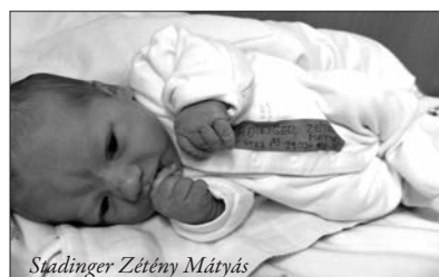
Stadinger Zétény Mátyás

Fájdalommal búcsúzunk az elhunyt öt balatonfűzfői lakosuktól. Részvétünket fejezzük ki a hozzátartozóknak!