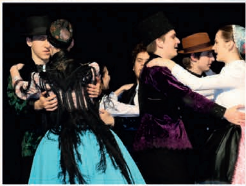
MAGYAR KULTÚRA NAPJA