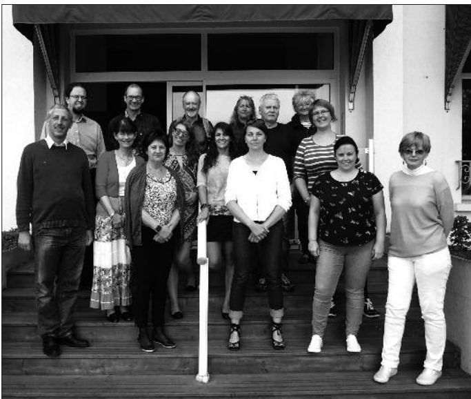
A csatolt kép az arcachoni (Franciaország) projekttalálkozózn készült.

Erasmus Plus program keretében megvalósított pályázatokat díjazott a támogatást nyújtó Tempus közalapítvány.