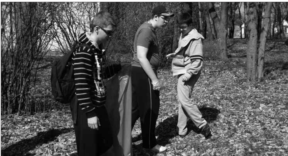
Diákok a tiszta Gyártelepért