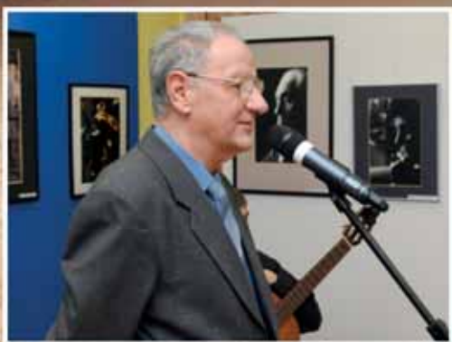
MIŁOS JÓZSEF KIÁLLÍTÁSA