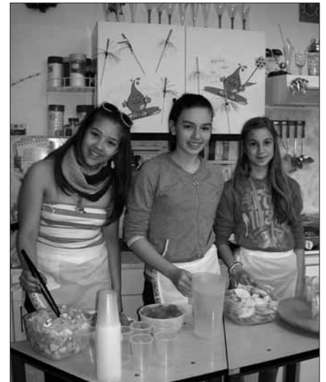
Ügyes gyerekek az Irinyiben