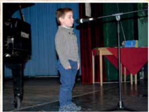
KÖLTÉSZET NAPI GÁLA