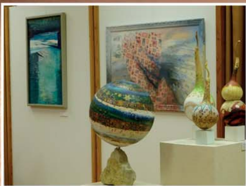
KULCSÁR ÁGNES KIÁLLÍTÁSA