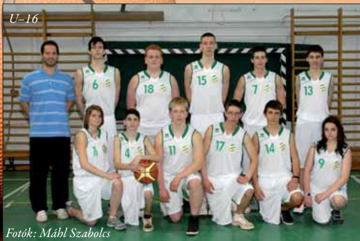
Fotók: Mábl Szabolcs