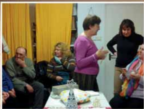
NYÍLT NAP A KÉZMŰVES KLUBBAN