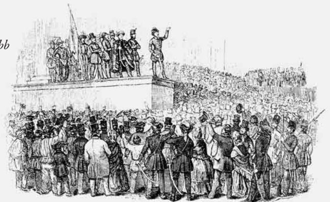
Petőfi a Múzeum lépcsőjén a „Nemzeti dal” szavalja

Hol sírjaink domborulnak, Unokáink leborulnak, És áldó imádság mellett Mondják el szent neveinket. A magyarok istenére Esküszünk, Esküszünk, hogy rabok tovább Nem leszünk!