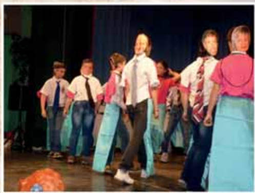
FARSANG AZ IRINYIBEN