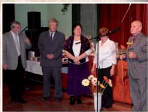
A NYUGDÍJAS KLUBOK VEZETŐI